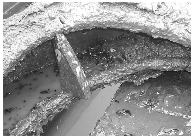
Figura 2. Local de encontro de Limnoperna fortunei em Sapucaia do Sul, Rio Grande do Sul, pneu imerso de uma embarcação abandonada.

Rio Grande do Sul (MCP), sob os números MCP 8988, para o registro da Praia de Paquetá, Canoas, referente ao mês de Junho de 2006 (n = 23 indivíduos); MCP 8989, para o registro da Praia de