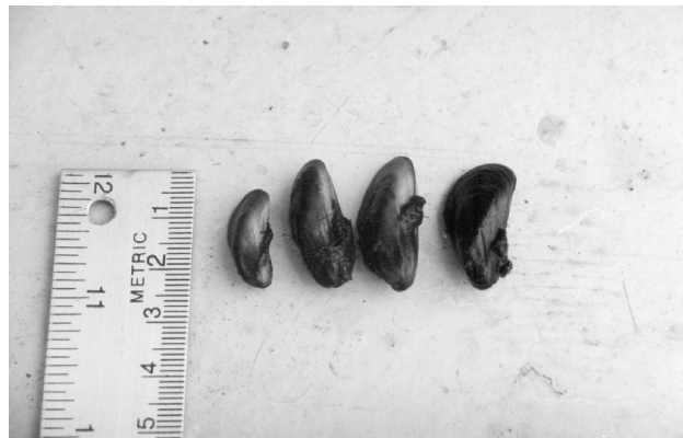
Figura 3. Aspecto geral, em vida, de Limnoperna fortunei , apresentando a variação de tamanho entre os indivíduos da colônia, coletado em 27/VII/06 em um trapiche na Praia de Paquetá, Canoas.

DARRIGRAN, G. 1997. El bivalve invasor Limnoperna fortunei (Dunker, 1857): Un problema para las tomas de agua dulce de las plantas potabilizadoras e industrias del